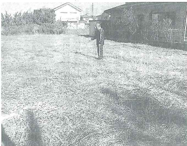
若者のマイホーム取得用の土地＝白子町浜宿字申高